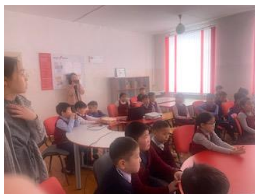
- Проведена беседа по Правилам дорожного движения среди учащихся 1-8 классов.