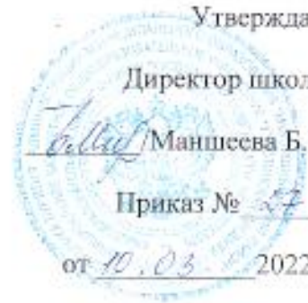
График посещения куратором школы-участницы Проекта 500+